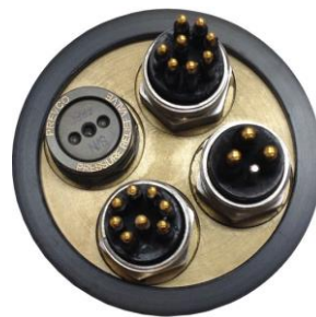
連接器後蓋 配置範例